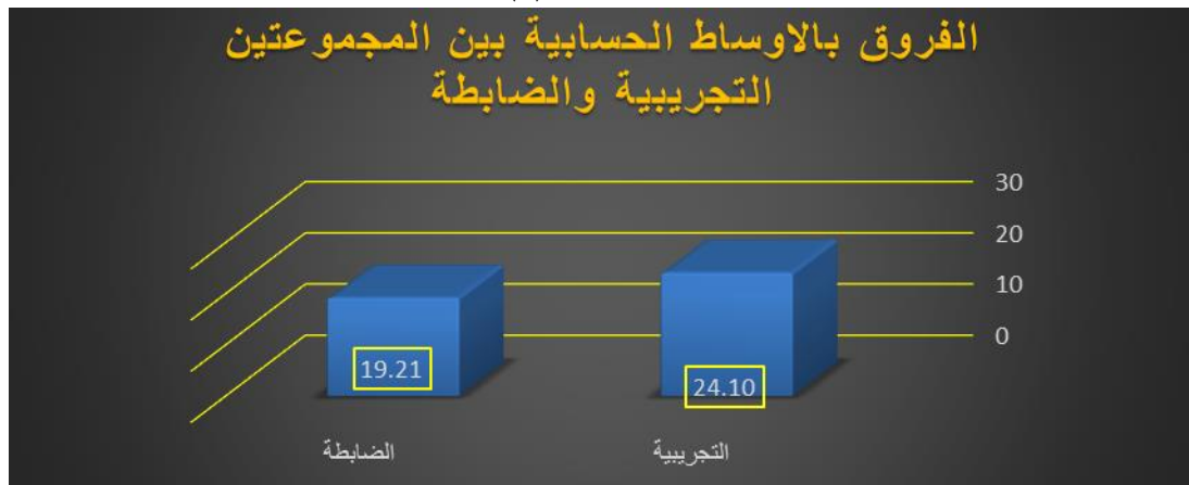
الشكل (3) يبين

توجد فروق ذات دلالة إحصائية لأن قيمة ت المحسوبة والبالغة (469,3) هي أكبر من القيمة الجدولية والبالغة (000,2) عند مستوى دلالة إحصائية (0,05) وبدرجة حرية (56). وكانت الفروق دالة لصالح المجموعة التجريبية لأن الوسط الحسابي لها بلغ (10,24) وهو أكبر من الوسط الحسابي للمجموعة الضابطة والبالغ (21,19). كما مبين في الشكل (3)