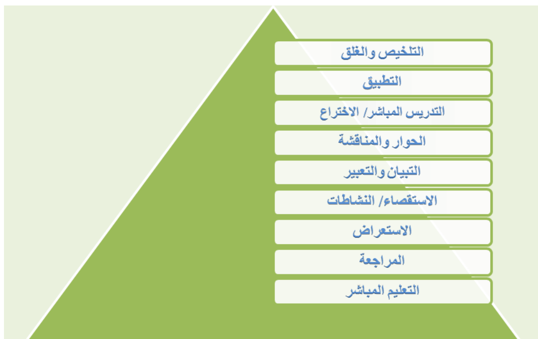
الشكل (4) من اعداد الباحث.

ويشير الباحث الى ان انموذج دانيال (التعليمي المعرفي) يعد مناسباً للمرحلة العمرية التي اختارها الباحث لكون خطوات تحتاج الى قدرات عقلية عليا ك(الاستقصاء، والتعبير، والمناقشة، والاختراع، والتطبيق، والتلخيص) وهذا كله يوفره الجزء العملي من جهة، ومن جهة اخرى عامل الوقت من جهة اخرى حيث يعد تطبيقه بهذه الخطوات بغاية الصعوبة لو كان وقت الدرس (45 دقيقة) بينما في الـ(120 دقيقة) يستطيع المعلم والطلبة المناقشة والحوار والنشاطات والاختراع والتطبيق ولاسيما التلخيص، لذا فان مراحل الانموذج مع طبيعة مادة الكهريائية بجزئها العملي يساعدا الطلبة على دفعهم نحو تفكير علمي افضل وتحصيل اعلى.